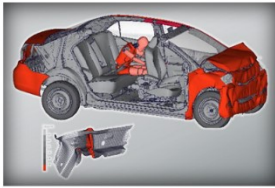
BERECHNUNG / CAE